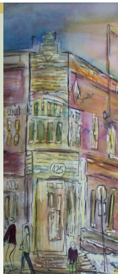
Œuvre de Clémence Gagné

Pour le parc régional de la Montagne du Diable, les activités 2015 porteront principalement sur la conclusion du financement afin de terminer l'aménagement des infrastructures prévues à la phase 1 de développement, soit le pavillon d'accueil, le village des Bâtitisseurs et certains aménagements au Pôle du Sommet. Des efforts seront également mis sur la forfaitisation et le développement du vélo de montagne.